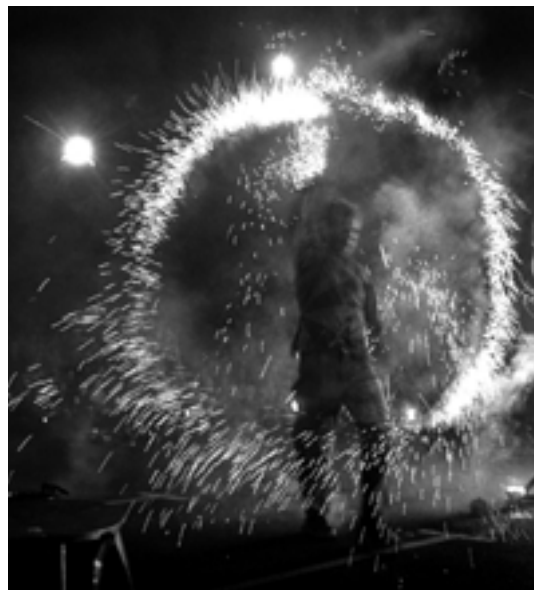
L'adhérent du XXI e siècle

C'est le sens de l'histoire, la nostalgie peut nous envahir mais le temps est révolu où les adhérents se réunissaient pour débattre d'utopies, se mobilisaient afin de faire connaître leurs buts. L'adhérent du XXI e siècle a laissé au vestiaire ses rêves plus ou moins révolutionnaires pour se recentrer sur des causes plus concrètes. L'adhérent du XXI veut bien se battre mais pour des intérêts immédiats. C'est un constat que l'UNPACT doit prendre en compte.