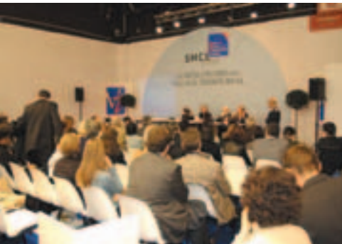
Salon des Maires