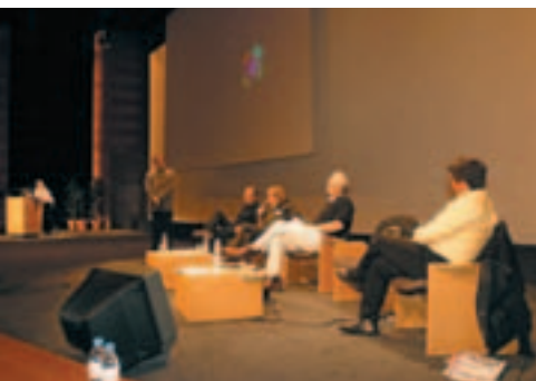
14e Forum National Cap Com

Directeur de la publication : Patrice Lecourt Redacteur en chef : Donatien Rousseau Comité de rédaction : Raymond Jeanne, Laurent Gayte, Alain Fichelle, Patrice Lecourt, Jean-Yves Cance. Imprimerie : Simédi@t Maquette : Stéphanie Périno - Albi Réalisation : Joaquim Domingues, Raymond Jeanne « La Lettre » est une publication de l'UNPACT. Siège social : 7, rue Bergère-75009 Paris Lettre d'information distribuée gratuitement Dépôt légal : décembre 2002