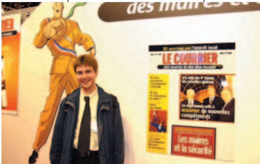
le plus jeune maire de France

objectifs de notre participation active à ce « Salon » très professionnel, quelques photographes territoriaux, dotés de notre dossier de presse, de la fiche de présentation et d'un bulletin d'adhésion, se sont engagés à donner suite à la visite sur notre « stand ».