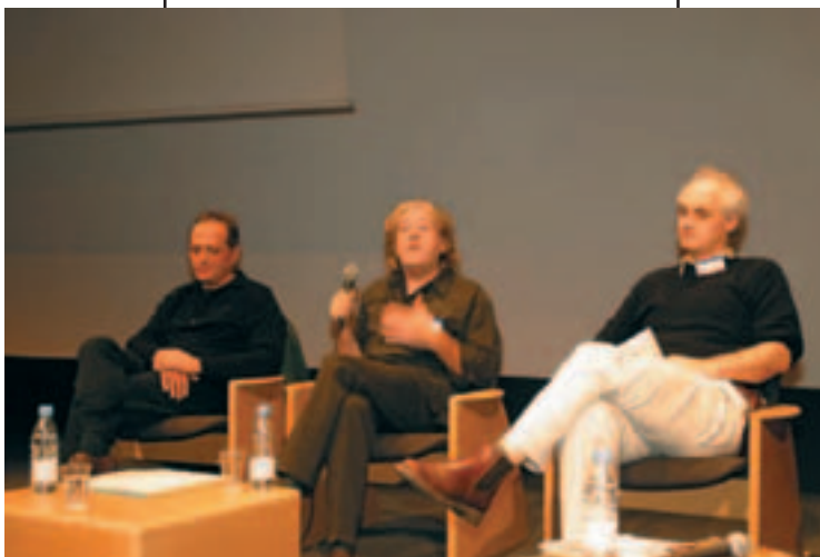
Donatien dans ses œuvres

Pour sa part, l'UNPACT, qui devient le quarante huitième adhérent – pour 20 euros – du