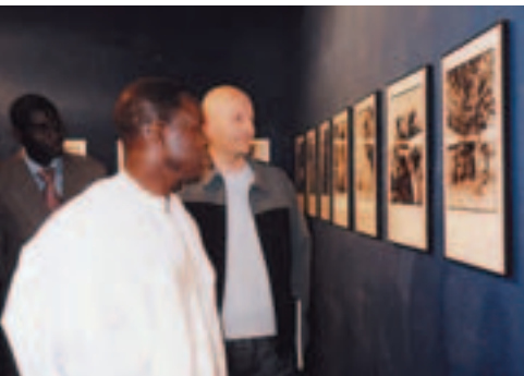
Exposition Bernard Brisé à Visa