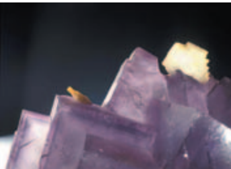
Fluorite par Patrick Ageneau