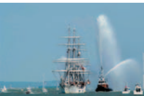
Armada 2003 par Dominique Hervé